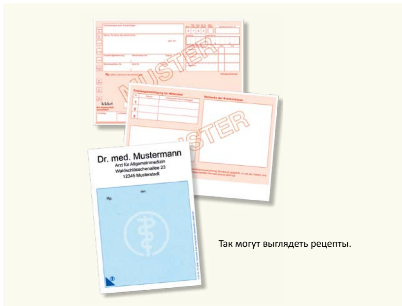
Так могут выглядеть рецепты.