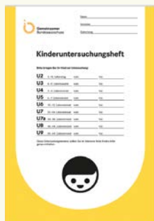
Так выглядит «Книжка профилактических осмотров ребенка».

Данные осмотры очень важны для здоровья ребенка. Обязательно пройдите все предложенные осмотры, с собой надо всегда иметь «Книжку профилактических осмотров ребенка» („U-Heft“) и паспорт прививок.