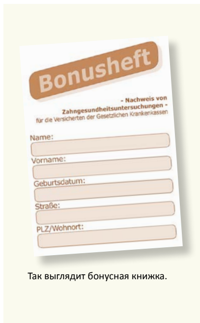
Так выглядит бонусная книжка.

Здоровые зубы – это еще и показатель уровня качества жизни. Поэтому так важны регулярные профилактические осмотры, даже и при отсутствии жалоб с вашей стороны. Больничными кассами в системе обязательного медицинского страхования перенимаются расходы на профилактику. Данные мероприятия помогают своевременно выявить и начать лечить определенные заболевания. Вам выдадут бонусную книжку (Bonusheft), куда заносится дата прохождения профилактических осмотров. Если вы можете подтвердить, что ежегодно (в возрасте до 18 лет – каждые полгода) посещали стоматолога, то при необходимости протезирования больничная касса предоставляет более высокие дотации.