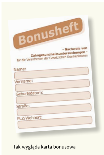
Tak wygląda karta bonusowa

Zdrowe zęby to lepsza jakość życia. Dlatego też, należy regularnie zgłaszać się na badania stomatologiczne – nawet wówczas, gdy nie występują dolegliwości. Ustawowe kasy chorych ponoszą koszty profilaktycznych świadczeń stomatologicznych. Podczas tych badań można w porę wykryć choroby zębów i je wyleczyć. W kasie chorych można otrzymać „kartę bonusową” (Bonusheft). Do karty bonusowej wpisywane są przeprowadzone badania. Jeśli udokumentują Państwo, że przynajmniej raz w roku zgłaszali się na badania stomatologiczne do dentysty (poniżej 18 roku życia przynajmniej raz na pół roku), wówczas kasy chorych dopłacają więcej do uzupełnień protetycznych – jeśli są one konieczne.