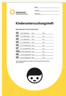
Tak wygląda książeczka zdrowia

Badania bilansowe są niezwykle ważne. Dlatego też, proszę się zgłaszać z dzieckiem na wszystkie badania i zawsze wziąć ze sobą książeczkę zdrowia/badań (U-Heft) oraz książeczkę szczepień dziecka. Badania bilansowe pozwalają na ocenę stanu zdrowia Państwa dziecka.