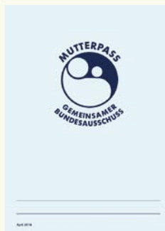
Tak wygląda karta ciąży.

Karta ciąży (Mutterpass) zawiera wyniki badań kontrolnych, wszelkie istotne informacje dotyczące przebiegu ciąży oraz rozwoju płodu. Dlatego też, kobiety ciężarne powinny ją mieć zawsze przy sobie.