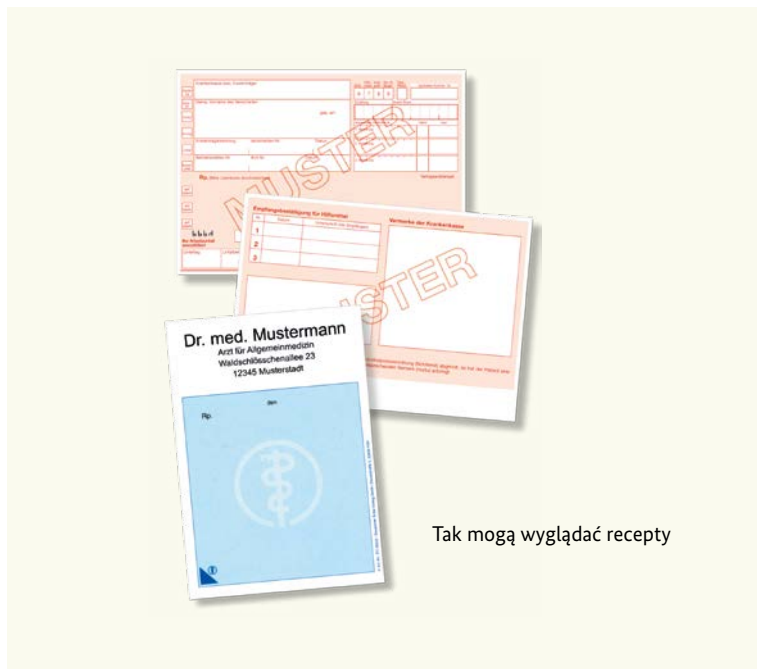
Tak mogą wyglądać recepty