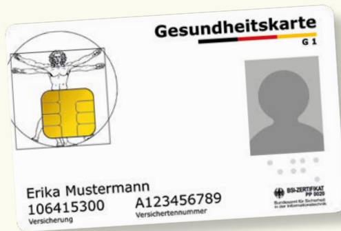
Ejemplo de muestra de una tarjeta sanitaria

Por favor, lleve siempre su tarjeta sanitaria electrónica (elektronische Gesundheitskarte) consigo cuando quiera recibir atención médica. Desde el 1 de enero de 2015 esta tarjeta constituye el único documento que acredita su derecho a recibir las prestaciones del seguro médico obligatorio. En la tarjeta sanitaria están registrados el nombre, la fecha de nacimiento, la dirección, el número de asegurado y el estado del asegurado (miembro, familiar o pensionado). Estos datos son obligatorios. La tarjeta sanitaria contiene además una fotografía en color.