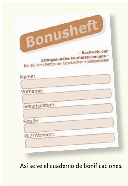
Así se ve el cuaderno de bonificaciones.

Unos dientes sanos suponen una buena calidad de vida. De ahí la importancia de las revisiones preventivas – aún cuando no tenga molestias. El seguro médico obligatorio cubre también estos exámenes preventivos. Estas revisiones tienen el fin de reconocer y tratar enfermedades dentales a tiempo. Para ello puede obtener un “cuaderno de bonificaciones” (Bonusheft) de su compañía de seguro médico, en el que se anotarán los exámenes preventivos. Si usted puede demostrar que ha acudido por lo menos una vez al año al dentista (para menores de edad como mínimo dos veces al año), su seguro médico le abonará una mayor cuantía cuando necesite prótesis dentales.