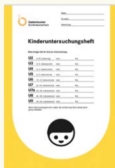
Así se ve el cuaderno de exámenes (U-Heft)

Estos exámenes son muy importantes. Acuda por lo tanto a todos ellos y lleve siempre consigo el cuaderno de exámenes (U-Heft) así como la cartilla de vacunas de su hijo/a. Estos exámenes son por la salud de su hijo/a