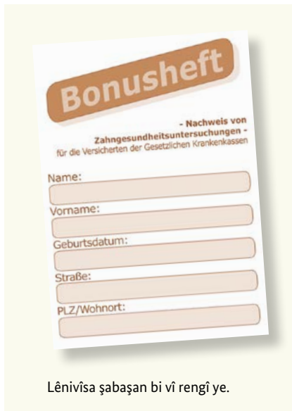
Lênivîsa şabaşan bi vî rengî ye.

Diranên saxlem parçeyek in ji qalîteya jiyane ne. Ji ber wê jî bi şeweyekî berdewam pişkinîna wan giring e, eger we çu gazinde û êş jî ji diranên xwe nebin. Qasa sîgorta tendurustiyê ya yasayî hemî mesref û xerciyên xizmetguzariya pişkinîne jî bi xwe digire. Ev pişkinîn jî dibin alîkar, bo hin nexweşiyên destnişankirî, ku berwext bêne diyarkirin û naskirin û her weha dermankirin. Hun dikarin ji sîgorta xwe ya nexweşiyê wek tê gotin “lênivîsa şabaşan” (Bonusheft) werbigirin. Di wê lénivîsê de pişkinînen we yê hun bikin têne nivîsin. Eger hun bikaribin, ku we bi kêmanî salê carekê (di bin 18 salî re bi kêmanî her niv salê carekê) diyar bikin, ku we seredana bijîjkeka diranan an bijîjkekê deranan kiriye, wê qasa sîgorta we ya nexweşiyê perene zêde di ser re bide, eger şûndiraneke pêdivî be.