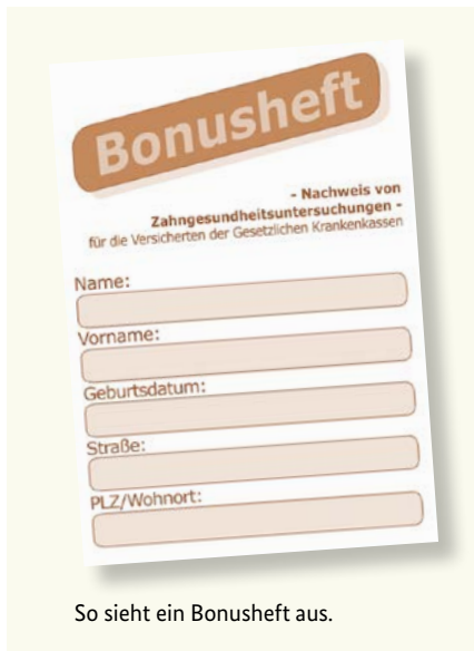
So sieht ein Bonusheft aus.

Gesunde Zähne sind ein Stück Lebensqualität. Deshalb sind regelmäßige Vorsorgeuntersuchungen wichtig – auch wenn Sie keine Beschwerden haben. Die gesetzlichen Krankenkassen übernehmen auch die Kosten dieser Vorsorgeuntersuchungen. Diese Untersuchungen helfen, bestimmte Erkrankungen frühzeitig zu erkennen und zu behandeln. Sie können dafür von Ihrer Krankenkasse ein sogenanntes „Bonusheft“ erhalten. In diesem Heft werden die Vorsorgeuntersuchungen eingetragen. Wenn Sie nachweisen können, dass Sie mindestens einmal im Jahr (unter 18 Jahren mindestens einmal pro Halbjahr) bei einer Zahnärztin oder einem Zahnarzt waren, zahlt die Krankenkasse einen höheren Zuschuss, sofern ein Zahnersatz notwendig wird.